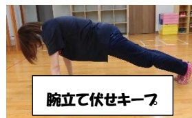
腕立て伏せキープ