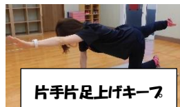
片手片足上げキープ